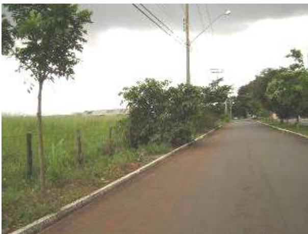
Calçada 01 – 03/04/2013