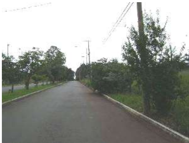
Calçada 02 – 03/04/2013