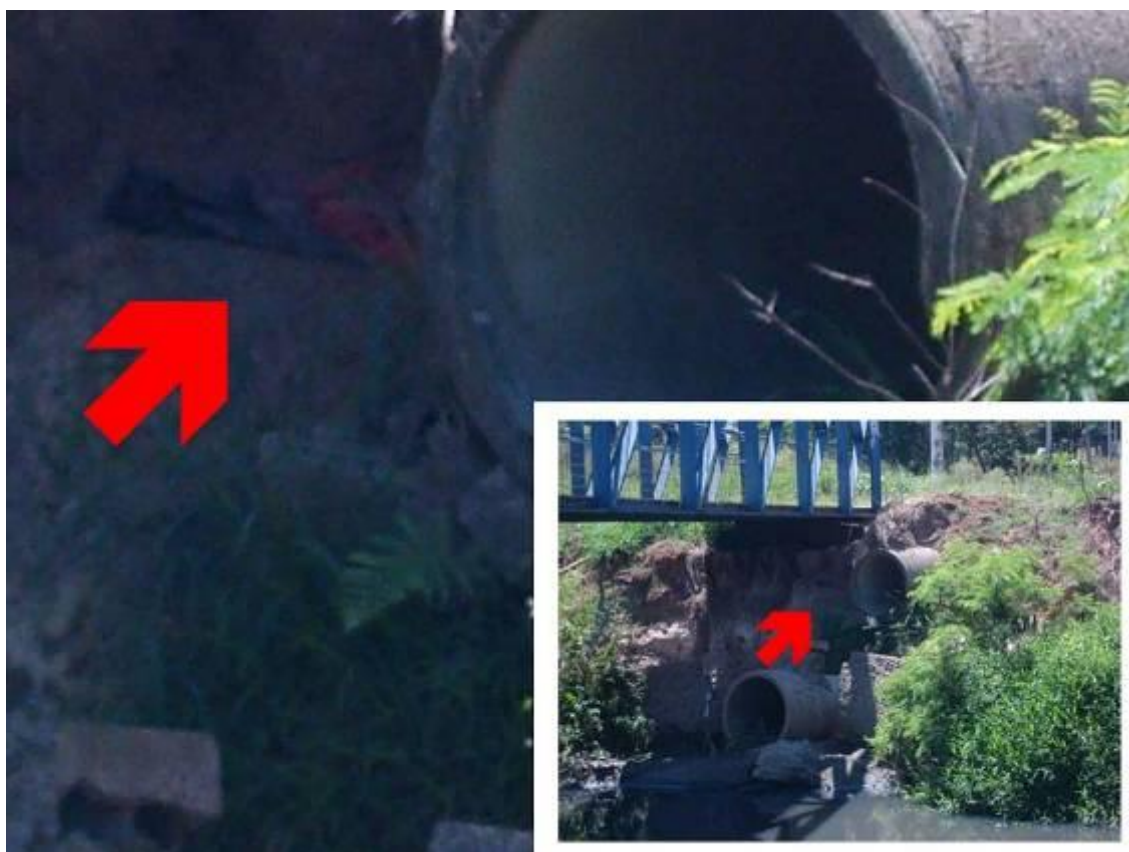
Foto 1 - Detalhe da aparente exposição da estrutura.