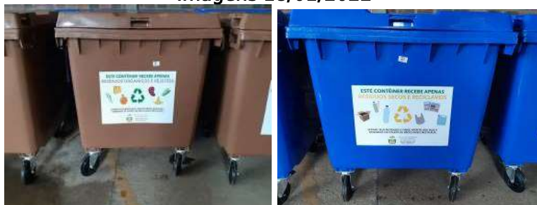
Modelos de Contêineres de Coleta Seletiva que podem ser aderidos no município