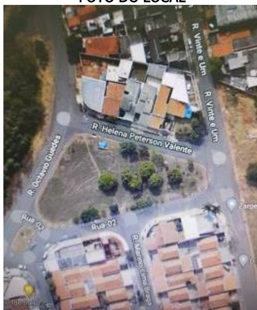
FOTO DO LOCAL