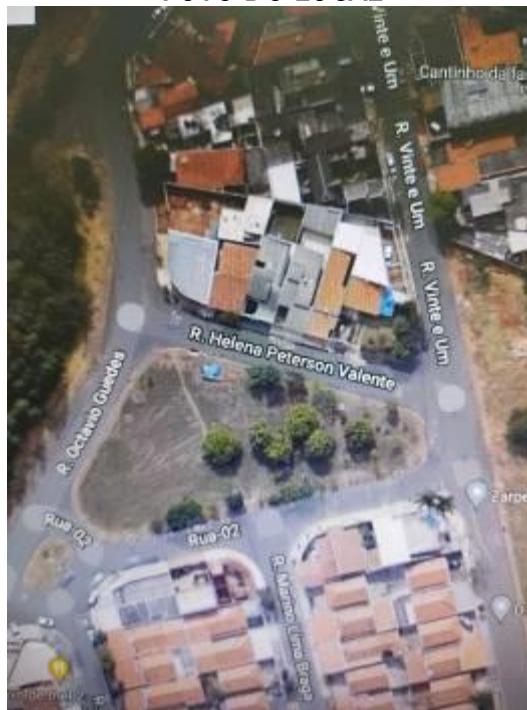
FOTO DO LOCAL