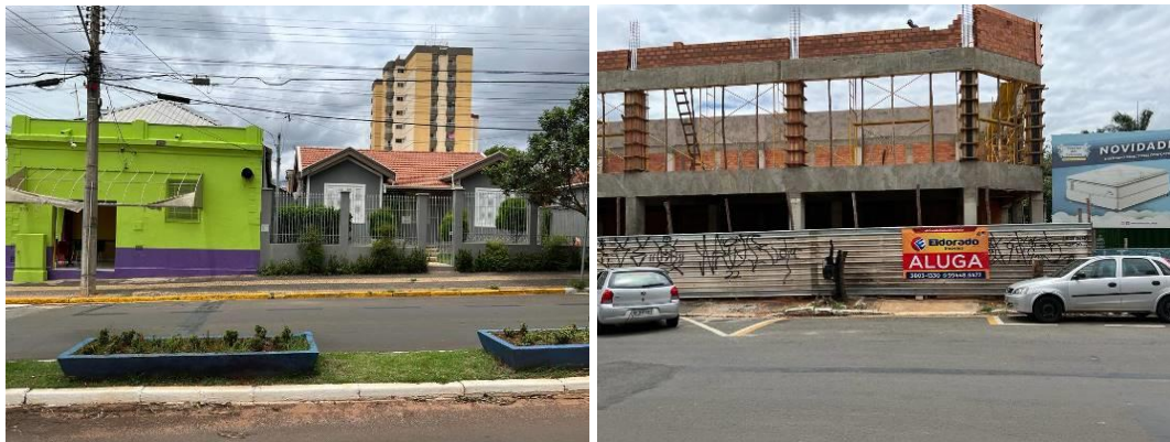
Imagem do local: