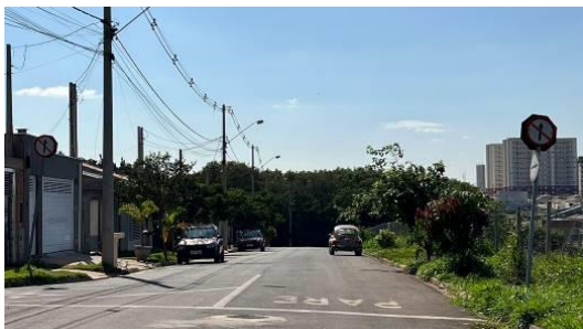
Imagem do local: